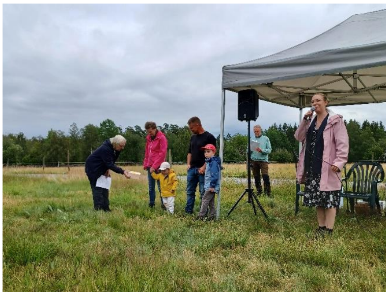
Utdelning av glashjärta.

Därefter delades ett glashjärta ut till värdparets Emma och Andreas Bergs dotter. Denna unga barnfamilj har flyttat till vår socken. Det är vi glada och tacksamma för.