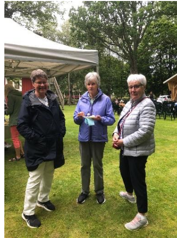
Besökare som köpte ostkaka