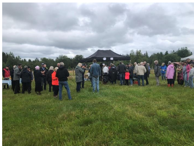
De modiga besökarna.