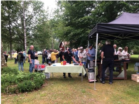
Besökare i "isterbandskön"